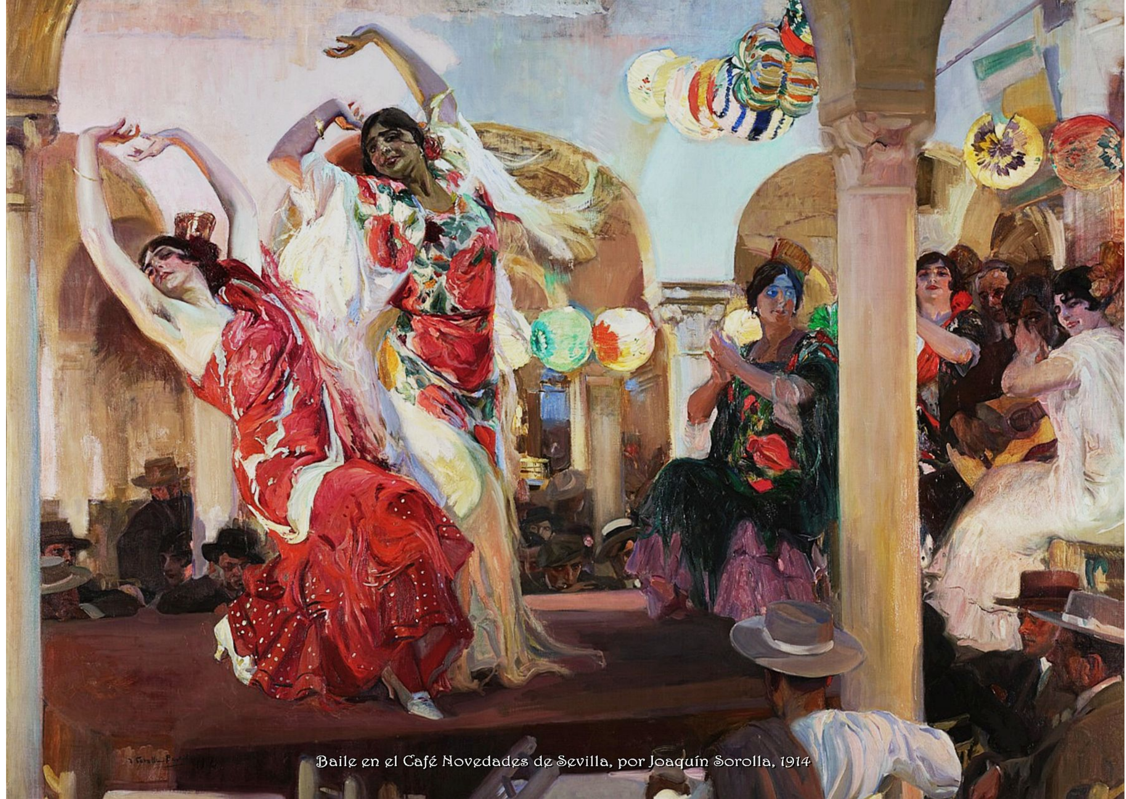
Baile en el Café Novedades de Sevilla, por Joaquín Sorolla, 1914