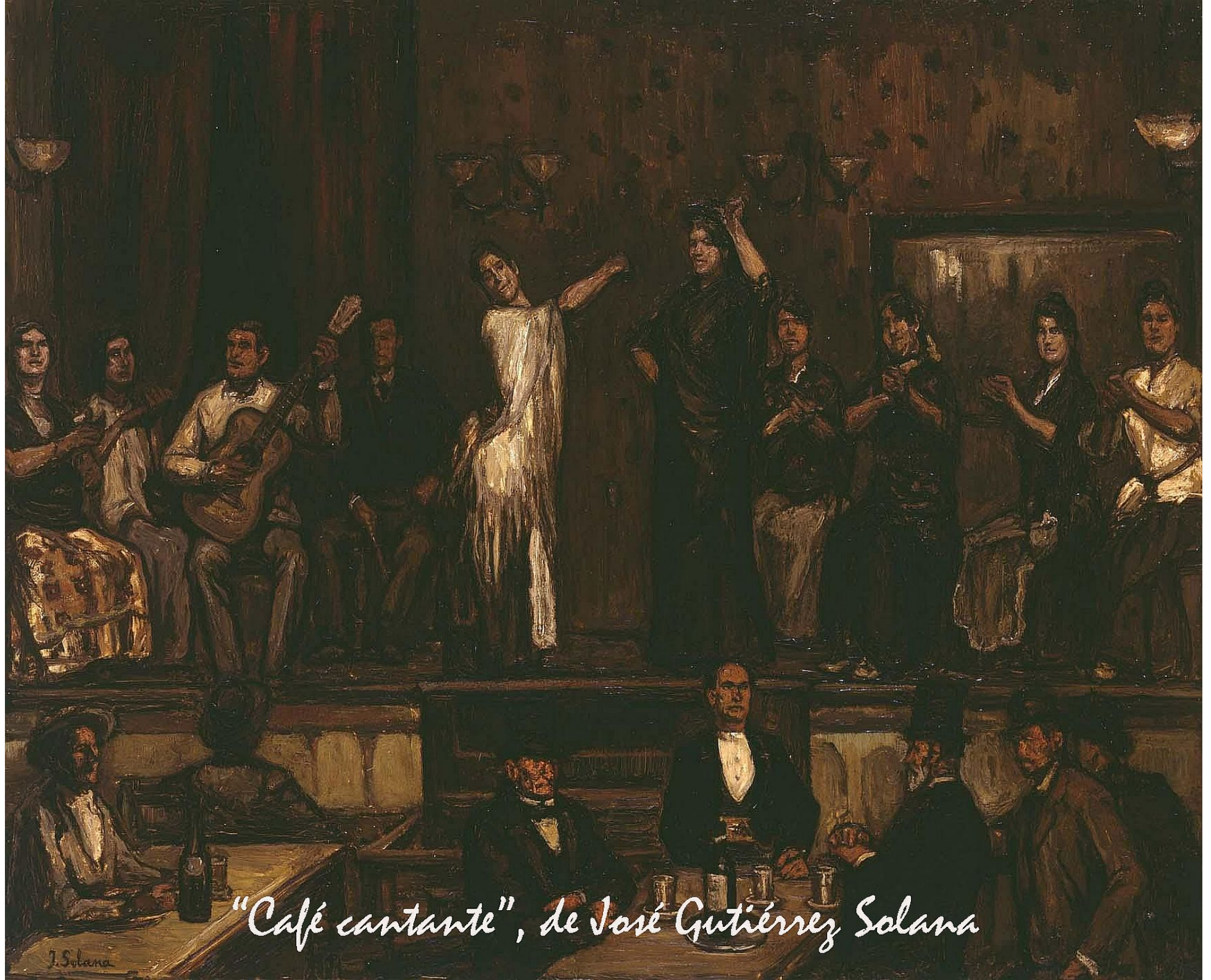
"Café cantante", de José Gutiérrez Solana