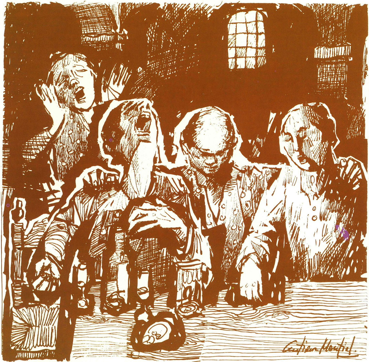
Cante por siguiriyas. (Dibujo.) Gutiérrez Montiel.