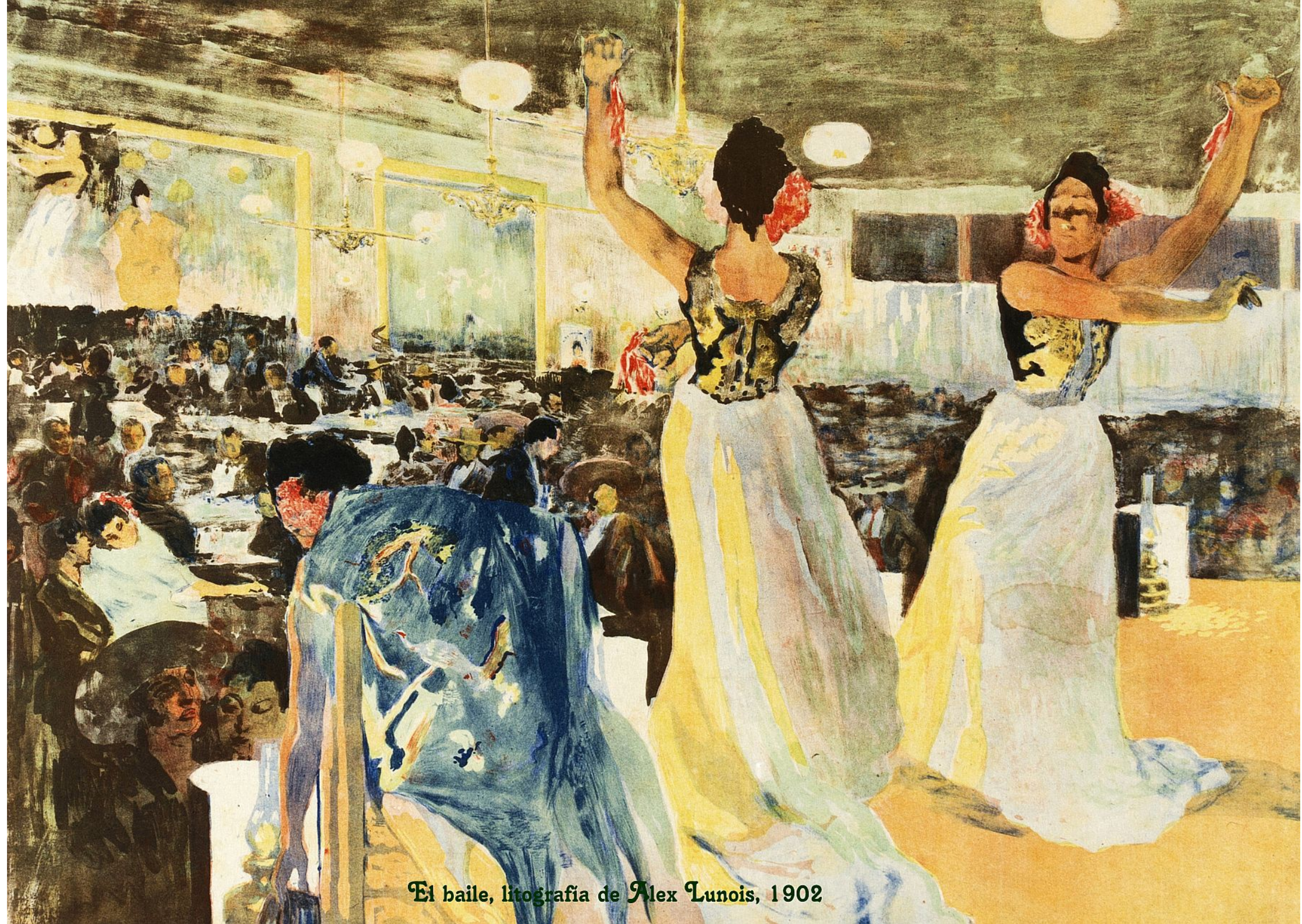
El baile, litografía de Alex Lunois, 1902