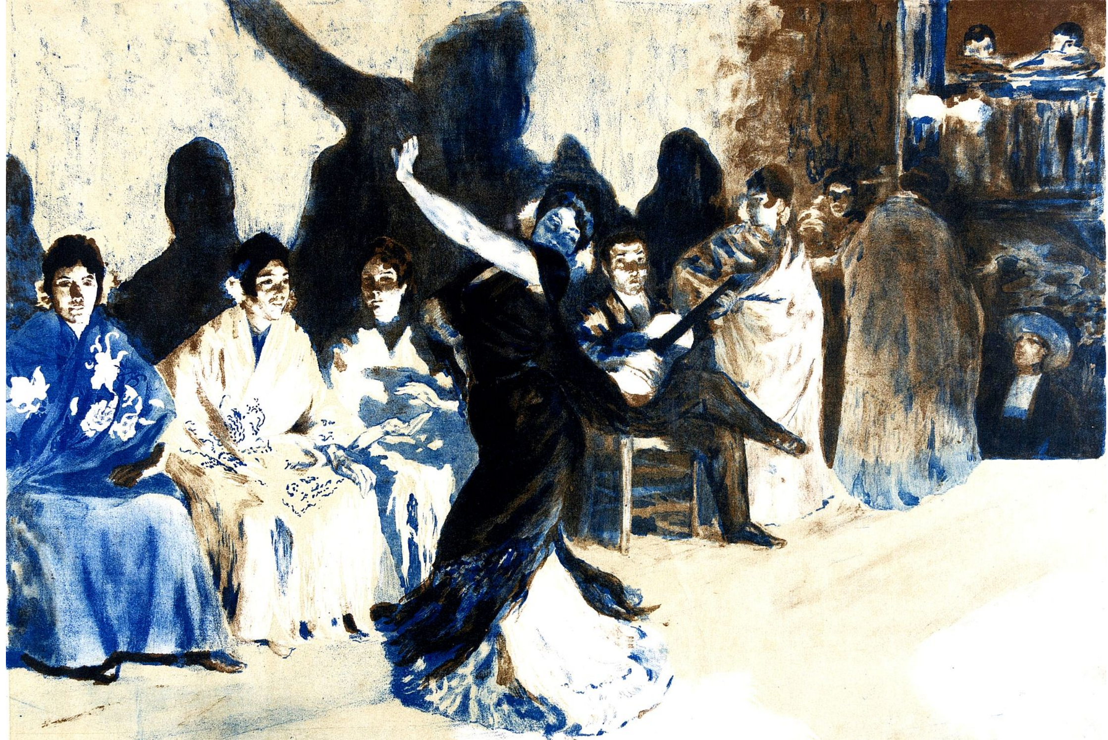
Baile flamenco, litografía de Alex Lunois, 1905