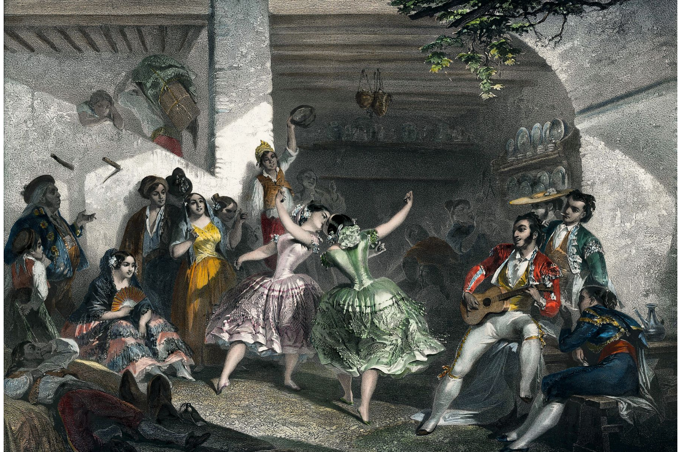
"El Jaleo de Cádiz" Eugène Giraud, h. 1850