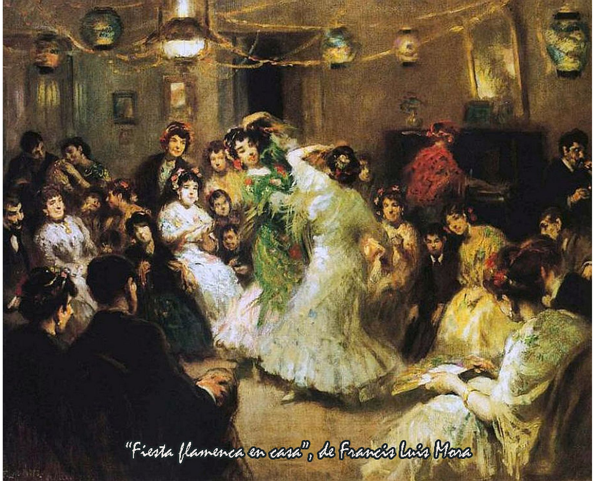
"Fiesta flamenca en casa", de Francis Luis Mora