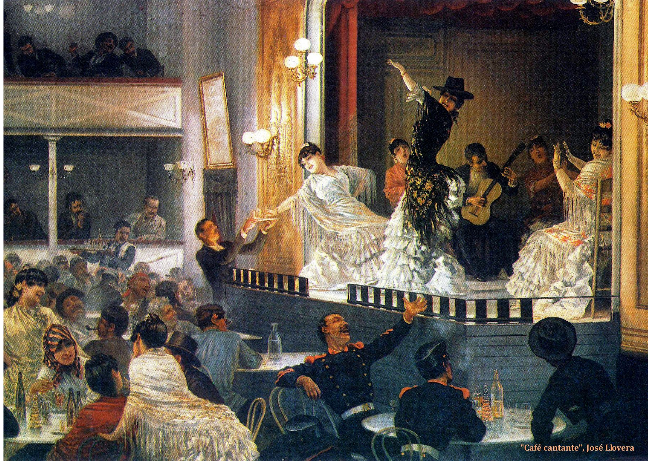
"Café cantante", José Llovera