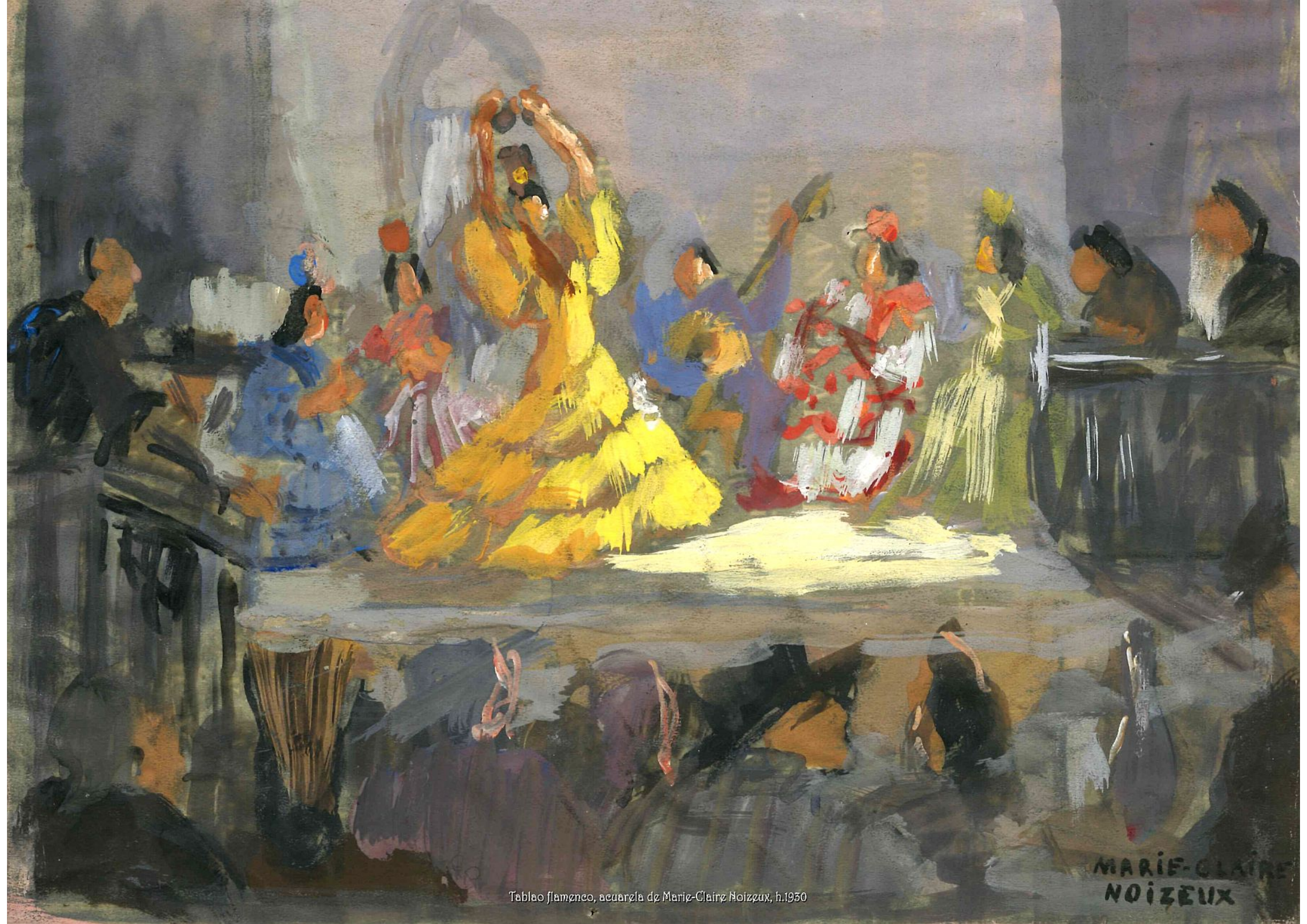
Tablao flamenco, acuarela de Marie-Claire Noizeux, h.1950