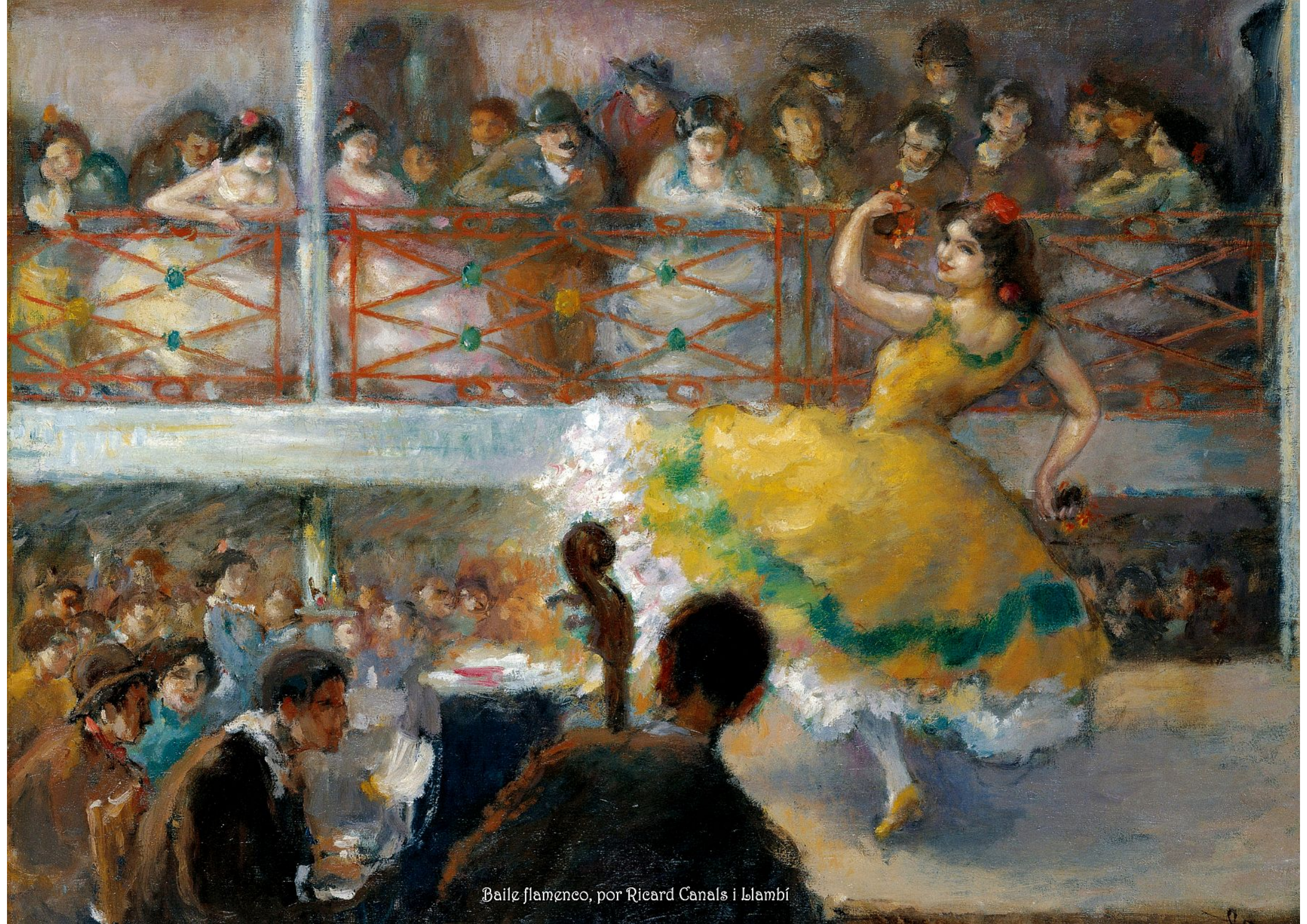
Baile flamenco, por Ricard Canals i Llambí