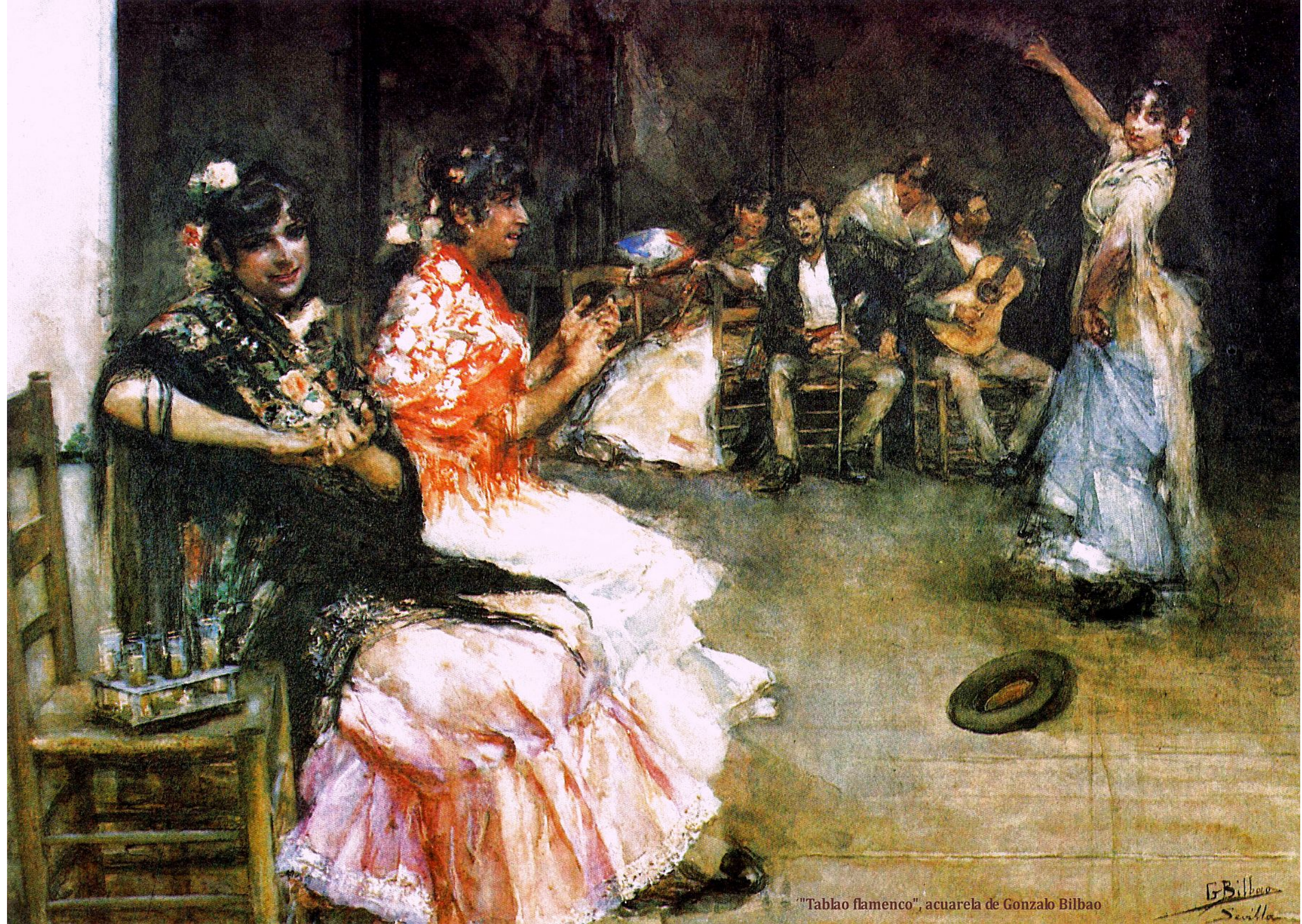
"Tablao flamenco", acuarela de Gonzalo Bilbao