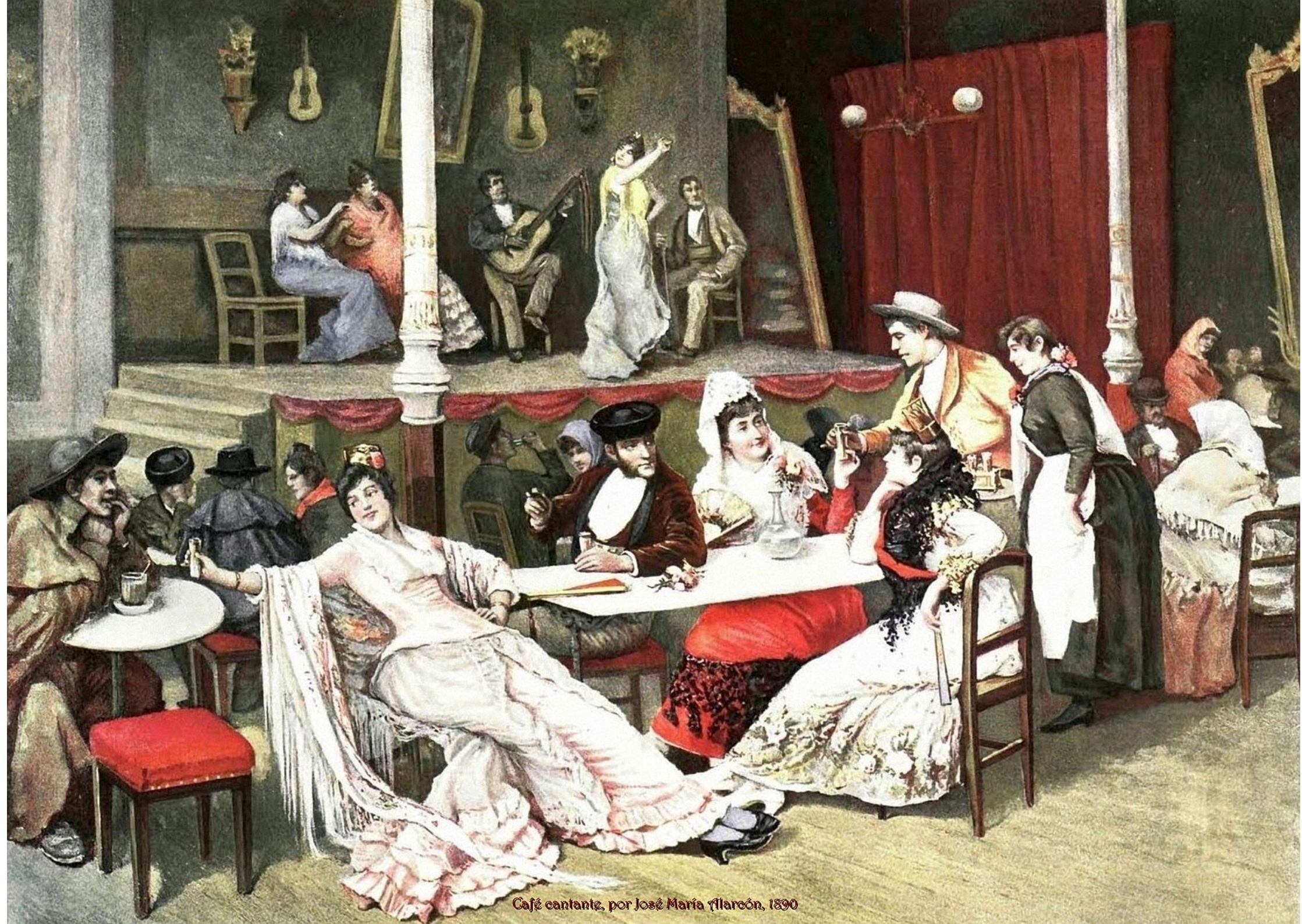
Café cantante, por José María Illarón, 1890