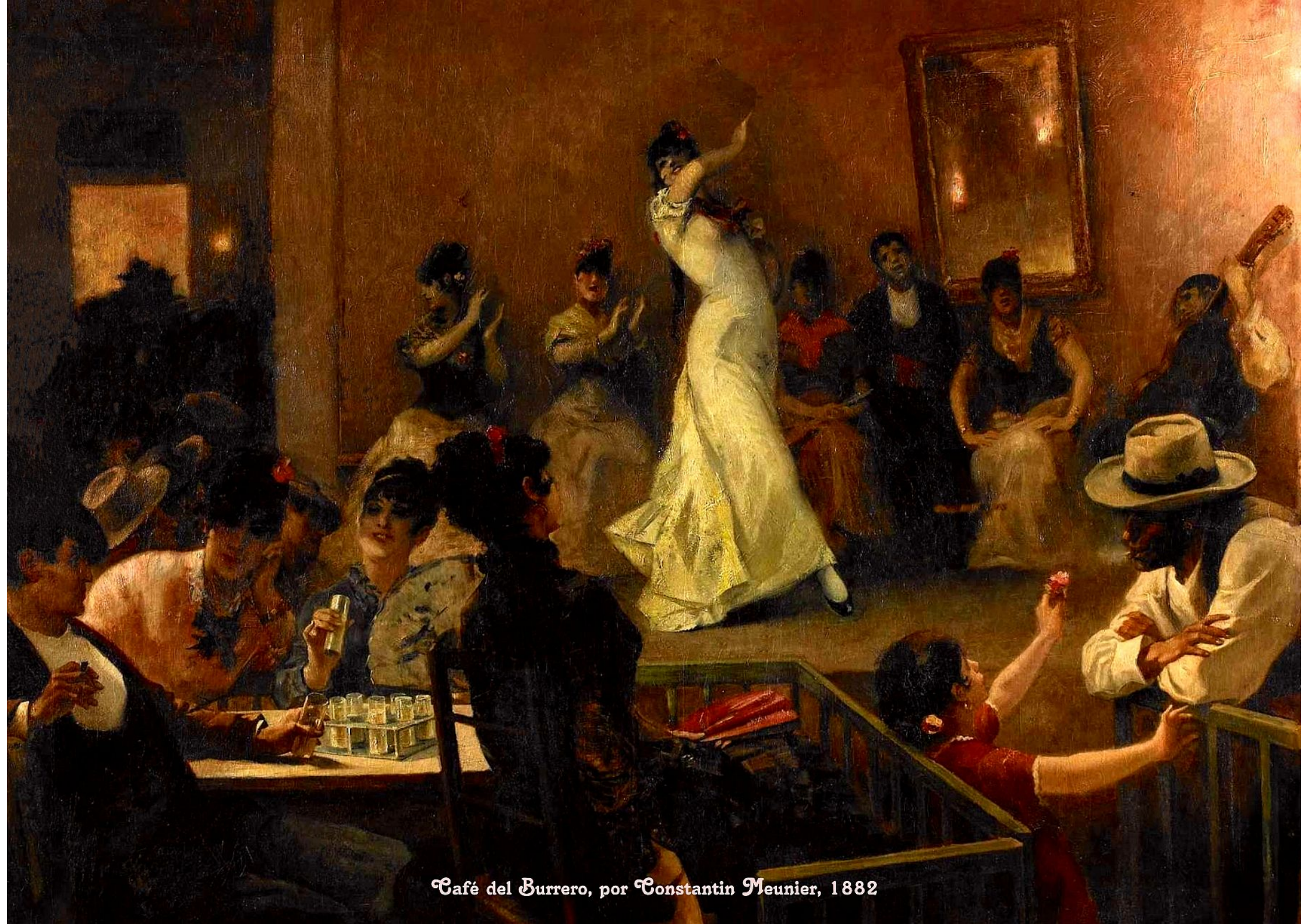
Café del Burrero, por Constantin Meunier, 1882