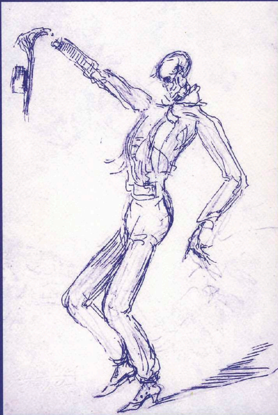
"Bailaor", esqueletomaquia de Carlos González Ragel