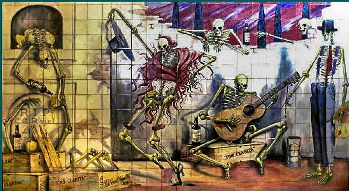
Fiesta Flamenca, por Carlos G. Rajel. Mural de azulejos en la Taberna Los Gabrieles, Madrid